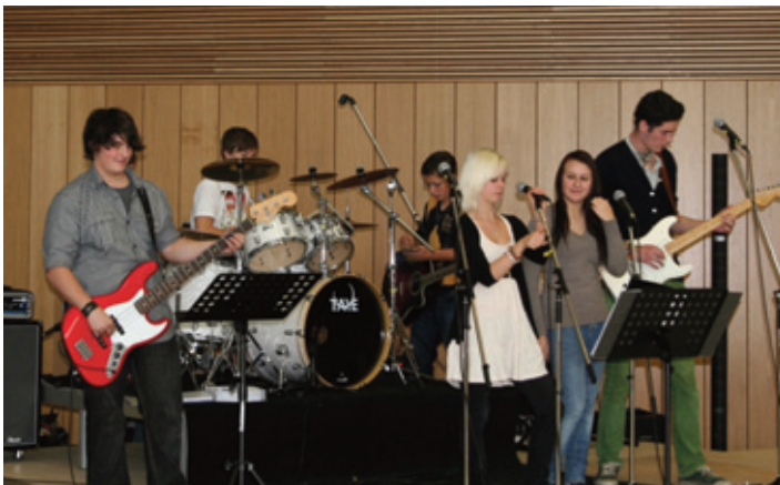
MINT meets Music: Die Schulband der Realschule Arnstorf