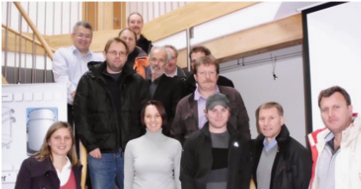
Die Teilnehmer der Kläranlagenbesichtigung im Ingenieurbüro Kottermair in Altomünster

Das Ziel bei der Abwasserklärung optimal wirtschaftlich zu sein und dabei auch einen großen Beitrag zum Umweltschutz zu leisten, will die Fa. Kottermair in der Kläranlage in Unterzeitzlsbach bei Altomünster (Region Dachau AGIL) umsetzen. Vertreter der XperRegio, insbesondere die Fachmänner aus den Kläranlagen und den Gemeindewerken begleiteten das Regionalmanagement zur Besichtigung dieser Kläranlage. Die Anlage konnte durch den Einsatz eines Biofilters die Energieeffizienz steigern.