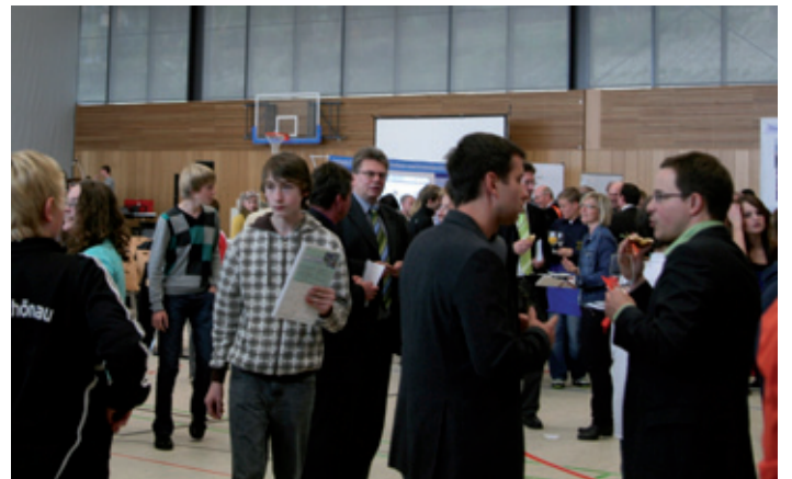
Lehrer und Unternehmer nutzten die Gelegenheit für Fachgespräche.