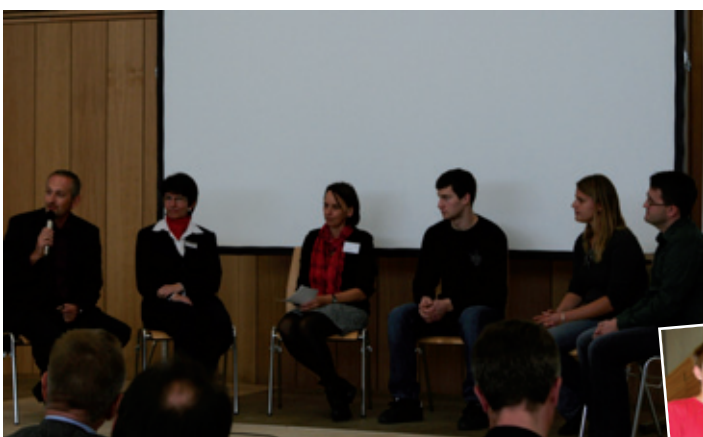
Beim abschließenden Expertengespräch diskutierten Vertreter aus Wirtschaft und Bildung mit den Fachkräften von morgen.

Unser Fazit: Der gelungene Auftakt motiviert uns, die Aktivitäten fortzusetzen, z.B. durch Projekte in den Schulen, die begleitet und unterstützt werden durch unsere Unternehmer, oder ein MINT-Ferienprogramm. Zur Vertiefung des Dialogs zwischen Unternehmern und Lehrkräften sind vier MINT-Abende geplant, der erste am 25. Januar. In Zusammenarbeit mit den Jugendämtern baut XperRegio ein Netzwerk „Haus der kleinen Forscher“ auf (s. Stellenausschreibung auf der letzten Seite)