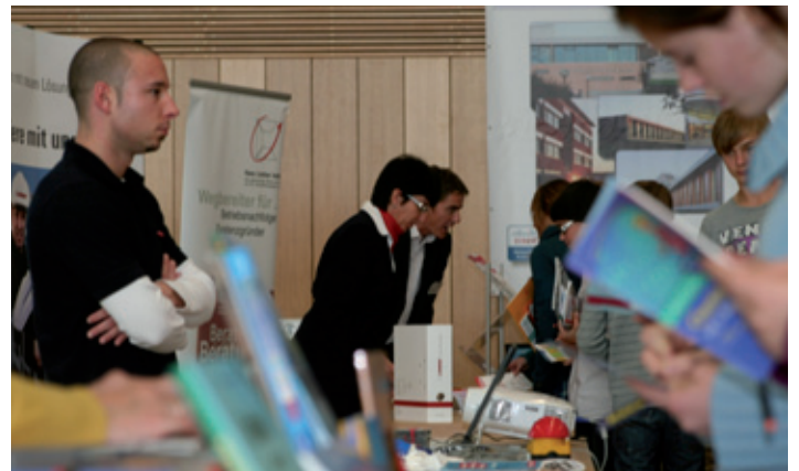
Heiß belagert wurden die Stände der beteiligten Institutionen und Projekte.