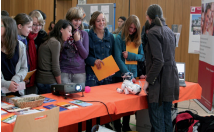
Die Uni Passau hatte ihren Roboter-Dackel mitgebracht – von ihm waren auch die Mädchen der Realschule Arnstorf begeistert.